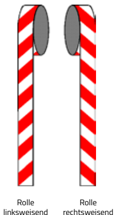
Rolle linksweisend Rolle rechtsweisend