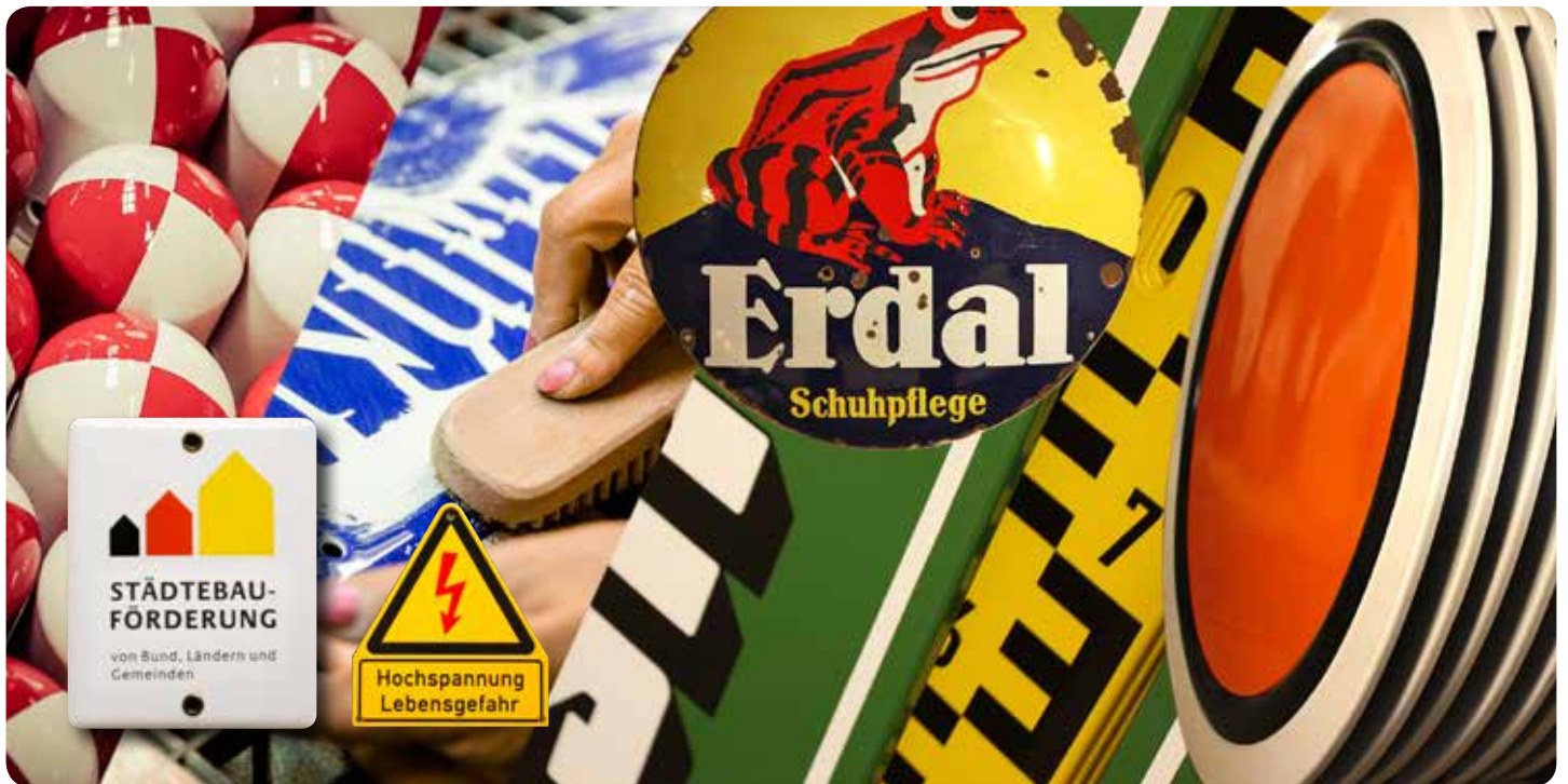
Preise auf Anfrage