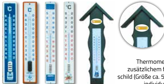
Thermometer auf Holzgrund mit zusätzlichem flachen, ovalen Emaille-schild (Größe ca. 50 x 80 mm) mit Ihrem individuellen Sonderaufdruck: Preis auf Anfrage

Die Preise gelten inklusive Verpackung und ohne Sonderaufdruck. Zuschlag für Sonderaufdruck: nach Aufwand